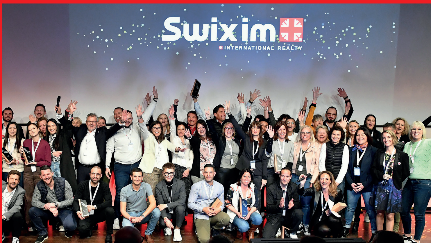
Consegna dei Trofei al Congresso di Losanna 2023

Un network attivo! Conferenze e seminari internazionali